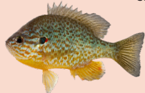
Sunfish / Риба-сонце