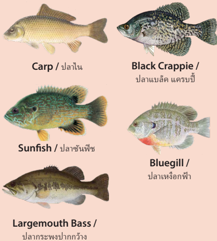
Carp / ปลาไน