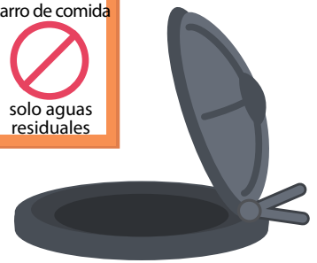
vertedero (con tapa)

Los carritos de comida que busquen una solución para la evacuación de aguas residuales pueden instalar un vertedero y una conexión al alcantarillado sanitario. Infórmese sobre el proceso de conexión.